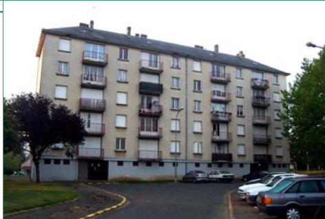
Cité Les Vauroux à Lucé

A Voves , 118 logements bénéficient depuis le 15 octobre de travaux de réhabilitation des façades, des pièces humides, des fenêtres, des couvertures ainsi que de la plomberie, des ventilations et des peintures. A Lucé , les cités Kennedy et Les Vauroux sont en travaux de couverture. Les bâtiments de la Friche aux Laines à Maintenon bénéficient du même traitement réparateurs. Ces travaux s'inscrivent dans le cadre d'une opération globale pour un coût total de 800.000 €.